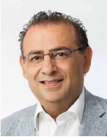
Alfonso Rodríguez Badal Batle de Calvià Alcalde de Calvià