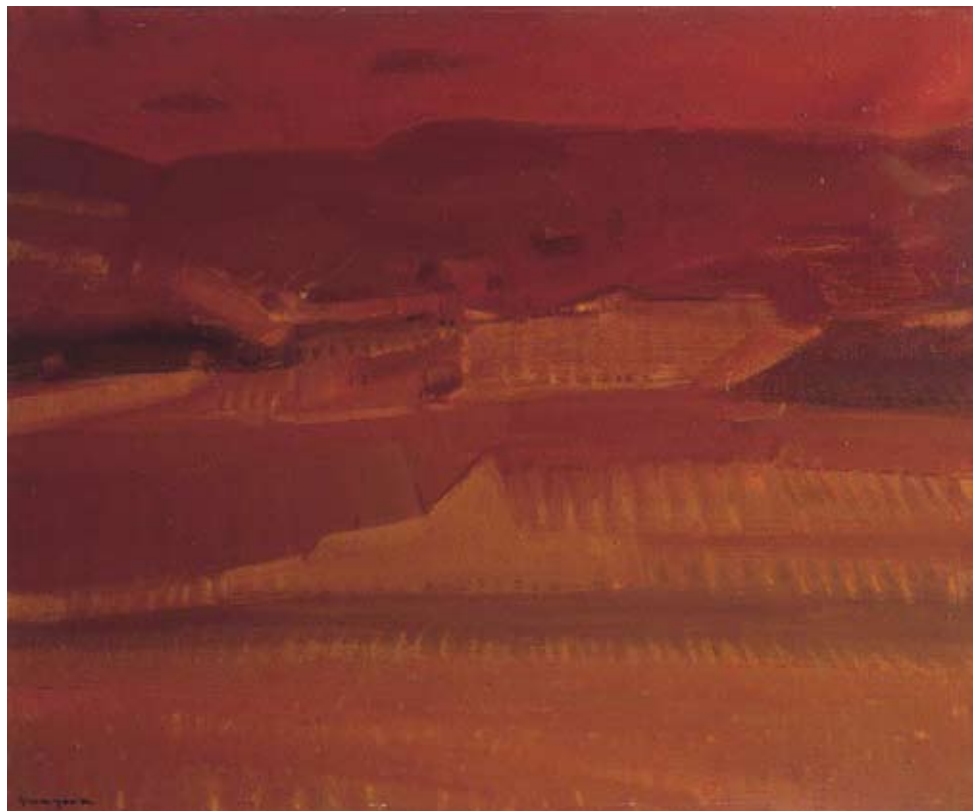
■ Calvià , 1974. Oli damunt tela, 43 x 36 cm. Premis Calvià, 1974. Accèssit.