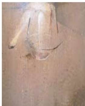
■ Joan Bennàssar Dona que es renta els peus , 1982. Tècnica mixta damunt tela, 224 x 200 cm. Premis Calvià, 1982. Tercer premi.