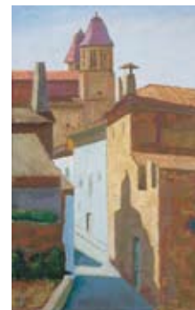
■ Josep Lluís Pla Cúpulas , 1971. Oli damunt tela, 83 x 54 cm. Premis Calvià, 1971. Tercer premi.