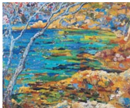
■ Rosa Palou Rubí Costa de la Calma , 1971. Oli damunt tela, 100 x 81 cm. Premis Calvià, 1971. Segon premi.