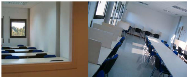
2 sales d'estudi—una amb cabines i l'altre sense— amb una capacitat de 30 persones cada una.