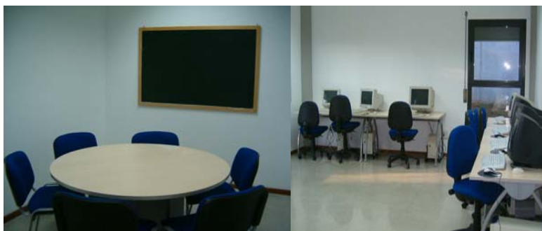
2 sales de treball en grup amb una capacitat de 16 persones.