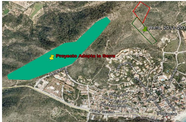
Imagen 2. Área afectada por el incendio del año 2011 en Paguera.