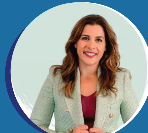
Sara López Agencia de Publicidad Saguario